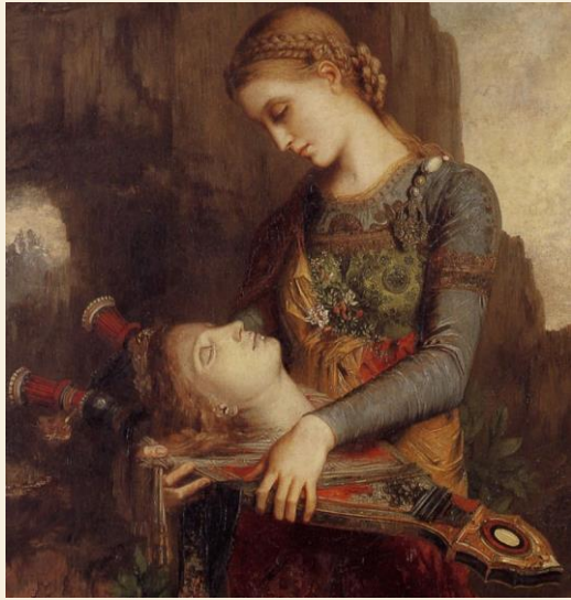
Gustave Moreau, Orphée , 1865.